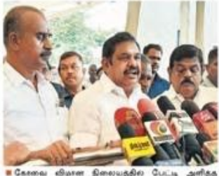
புலம்பெயர் தொழிலாளர் சங்கங்களின் சார்பில் பழனிசாமி பேசும் போது

சென்னை, நவ. 14 - "அ.தி.மு.க.- ஆட்சி சீர்திருத்தம்... தன்னை மறந்து; பதவியை மறந்து ஸ்டாலின் பேசுகிறார்: பழனிசாமி"